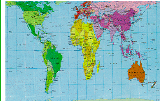
Mapa projecció de PETERS

Informació i comandes: La Tenda de Tot el Món. Tel. 962 679 026 – Correo: pedidos@la-tenda.org - www.la-tenda.org/botiga